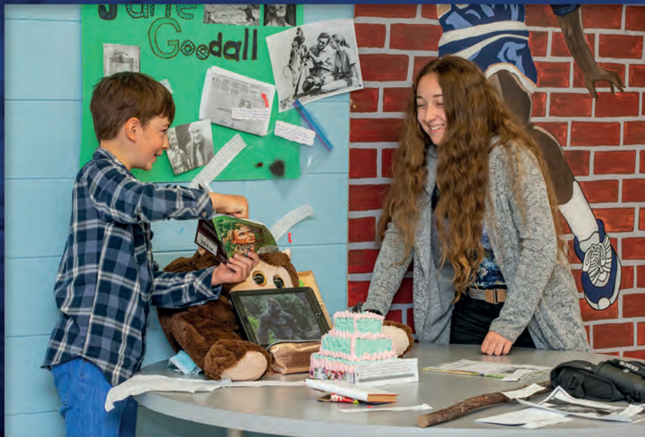
Achille et Jewels